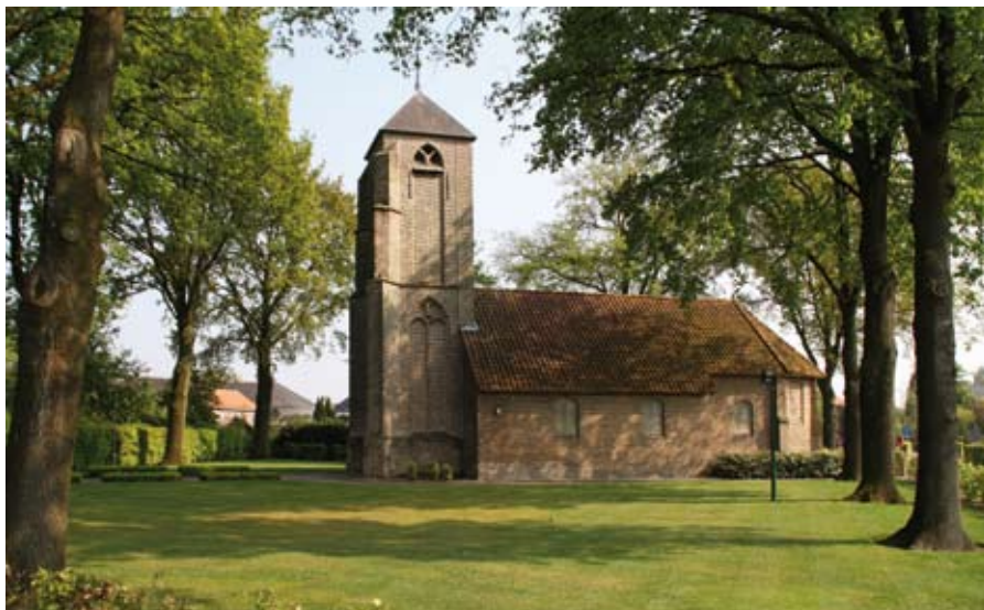
De Sint Jacobskapel in Galder-Strijbeek is gesticht in 1468

De gemeente heeft van de provincie € 750.000 ontvangen voor de uitvoe-