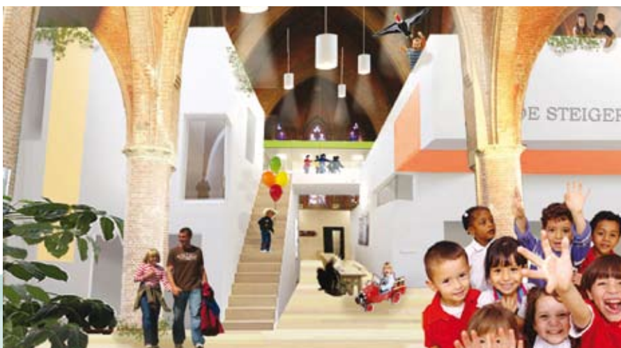
Sfeerimpressie MFA Stampersgat

( www.goudenpiramide.nl/geschiedenis/2010 )