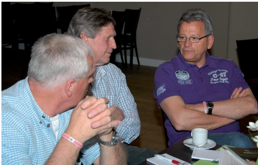
Volop discussie onder de leden

Kortom; communicatie over en weer tussen burgers en overheden en besef daarbij dat alleen maatwerk oplos-