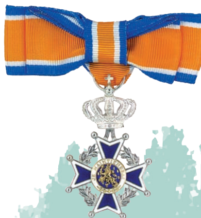
Lid in de Orde van Oranje Nassau Damesuitvoering

van de burgemeester. Er zit een uitvoerige toelichting bij en als je vragen hebt mag je die ook per mail aan onze bestuursleden stellen: zij hebben de nodige ervaring met deze materie. Als stelregel wordt in de meeste gevallen aangegeven dat de persoon de afgelopen 15 jaar aaneengesloten zich moet hebben ingezet voor de gemeenschap.