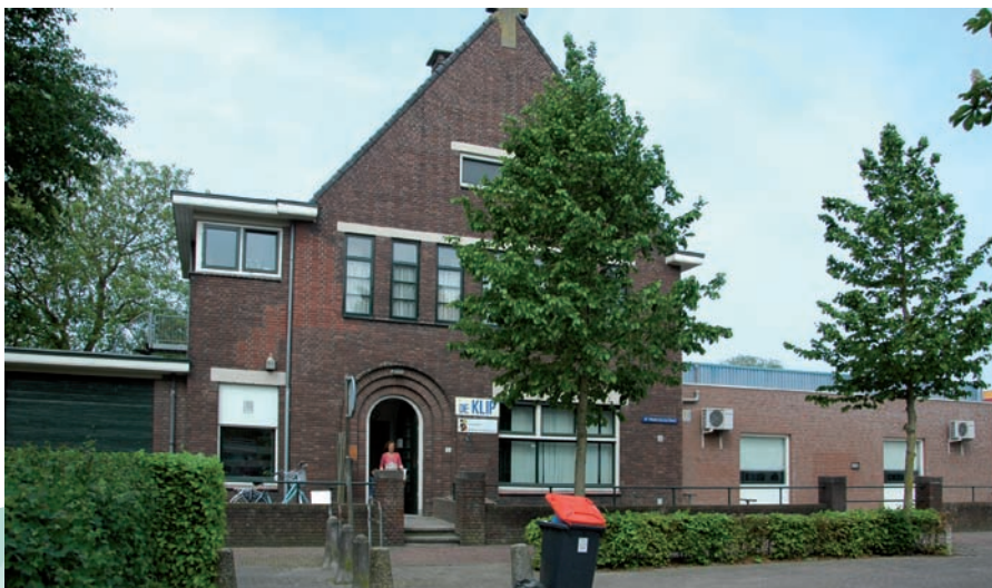
Dorpshuis De Klip