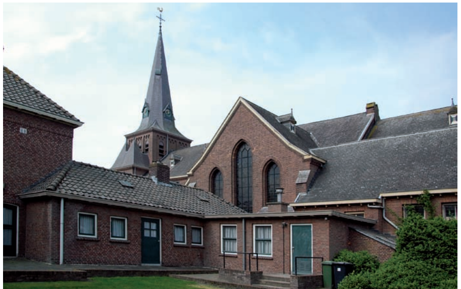
De Rooms-Katholieke Kerk Sint Marcoen (Marculphus)