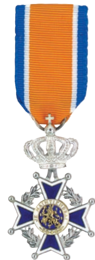
Lid in de Orde van Oranje Nassau Herenuitvoering

De formulieren voor het aanvragen van een Koninklijke Onderscheiding kun je opvragen bij de gemeente, meestal bij het bestuurssecretariaat