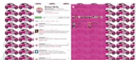
DorpenDerby op Twitter

Op de sociale netwerksite LinkedIn, www.linkedin.com is een speciale groep 'Leefbaarheid kleine kernen' en een groep 'Leefbaarheid Provincie Noord-Brabant' actief. <<<