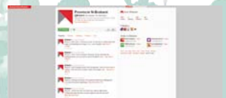
De provincie Noord-Brabant op Twitter