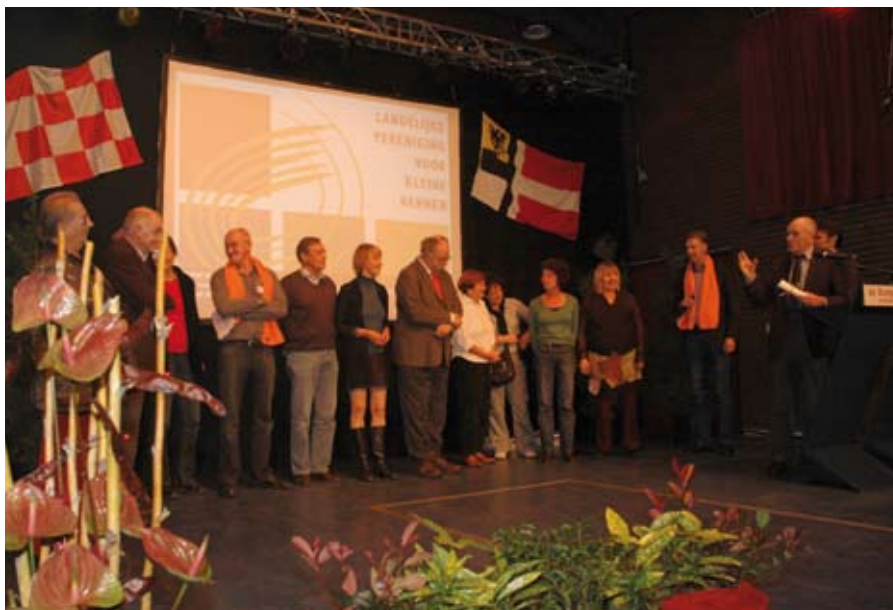
Vlak voor de prijsuitreiking luisteren de acht genomineerden in spanning wie van hen het meest vernieuwende dorp van Nederland zal worden

In de beperkte tijd die er tussen de activiteiten zat, konden de dorpen