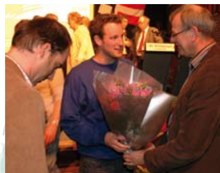
Uiteraard waren er bloemen voor de twee genomineerden uit Brabant

Esbeek hebben wij ervaren als een dorp met een bloeiend verenigingsleven, waar de bewoners een sterke band met het dorp hebben. Het dorp geeft blijk van een lange termijn toekomstvisie en een brede kijk op dorpsontwikkeling. Vernieuwend is het oprichten van een coöperatie en de combinatie museum/ dorps-huis-kamer. De bewoners komen op de jury over als gedreven, eigenzinnig en vastberaden. "Esbeek regelt het".